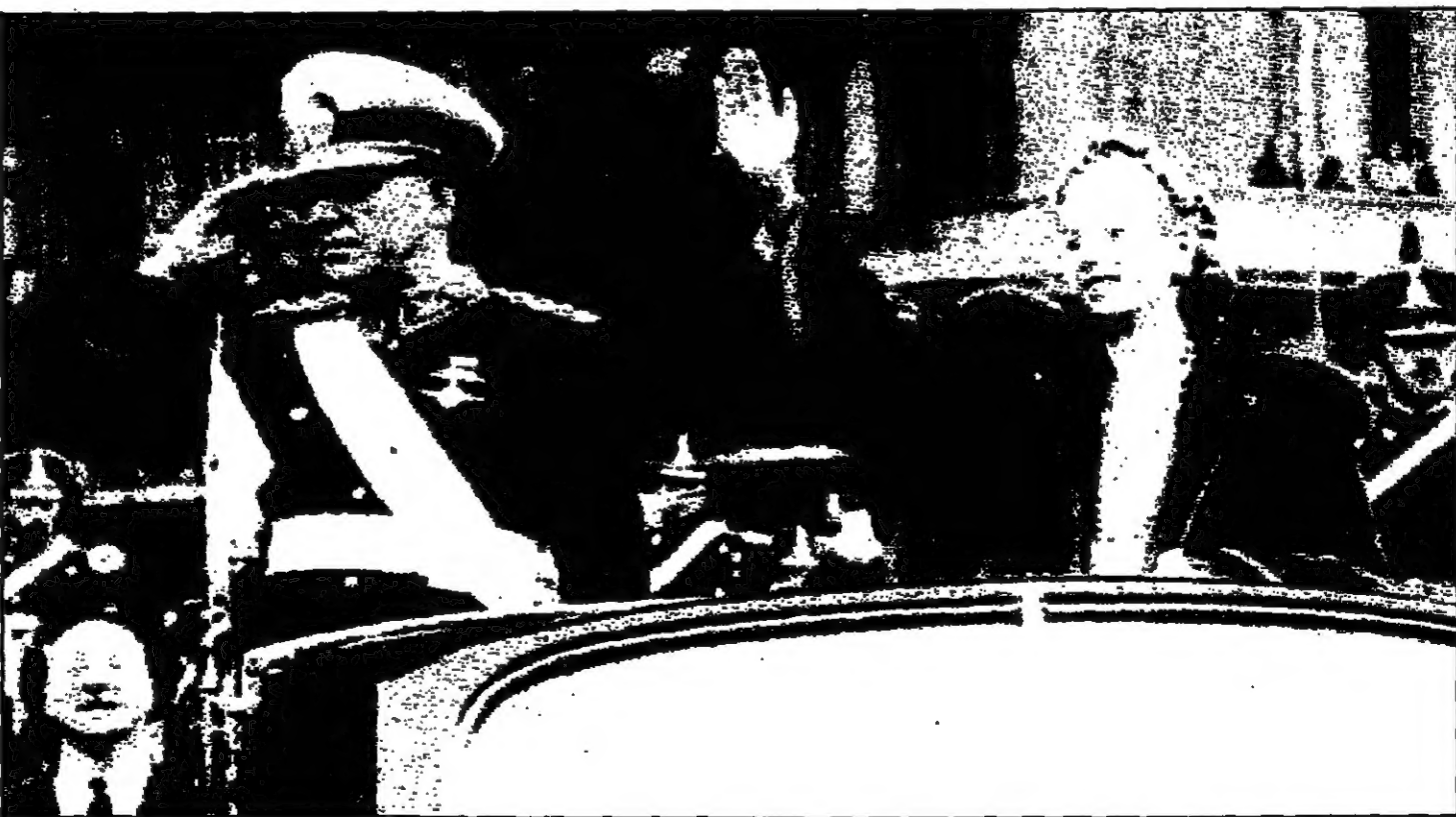
إيفيتا بيرون الحقيقية مع زوجها